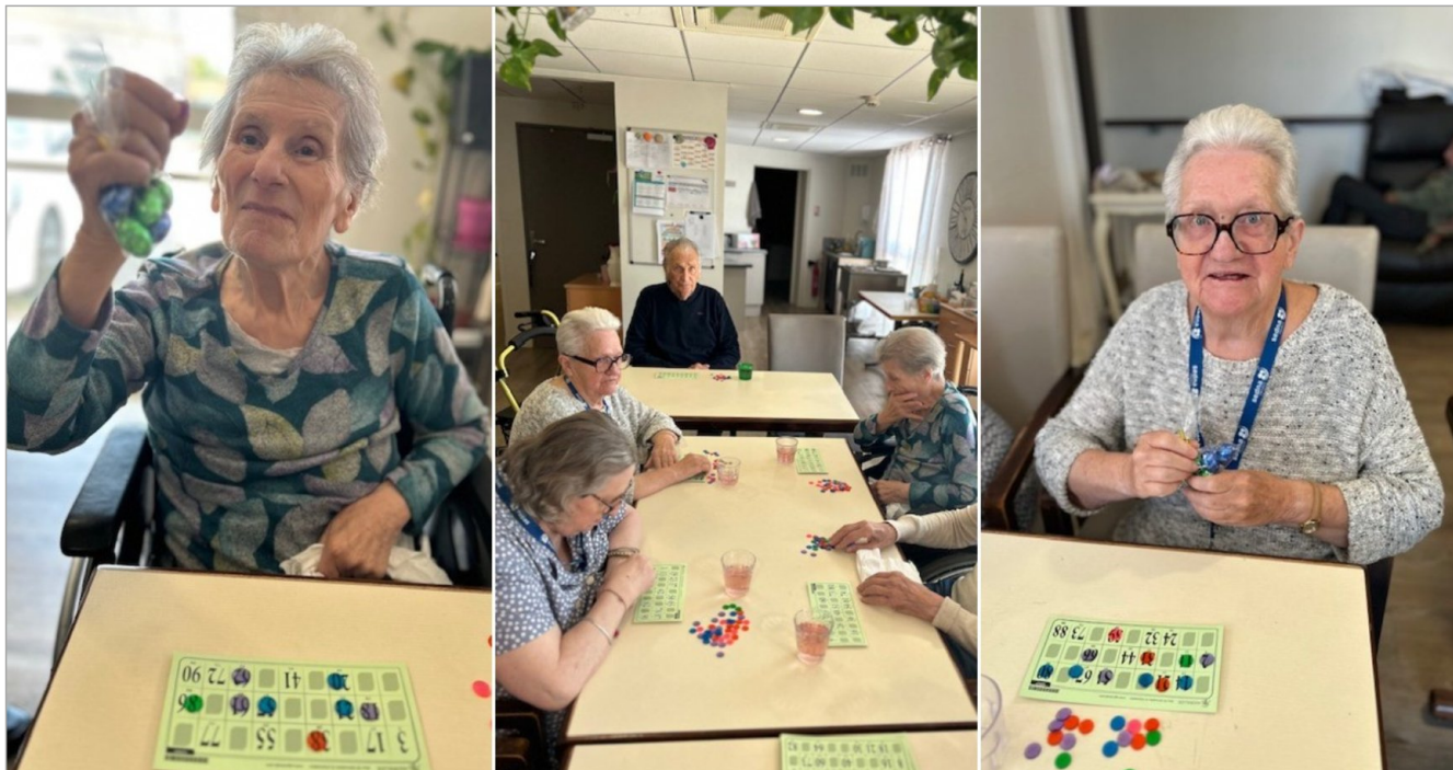
Et voici nos premières gagnantes au Loto du PASA