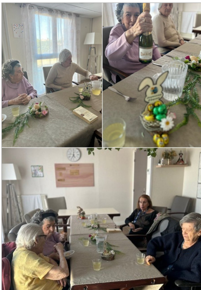
Dimanche 5 avril : Apéro de Pâques au PASA