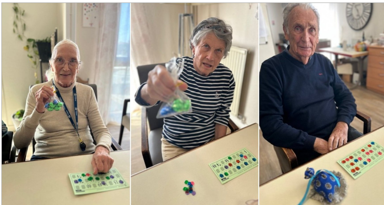
Le Loto fait toujours des heureux... surtout quand il y a du chocolat ;-)