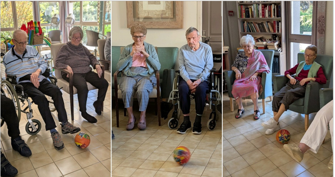
Ce mercredi , nous étions 18 à jouer au foot !