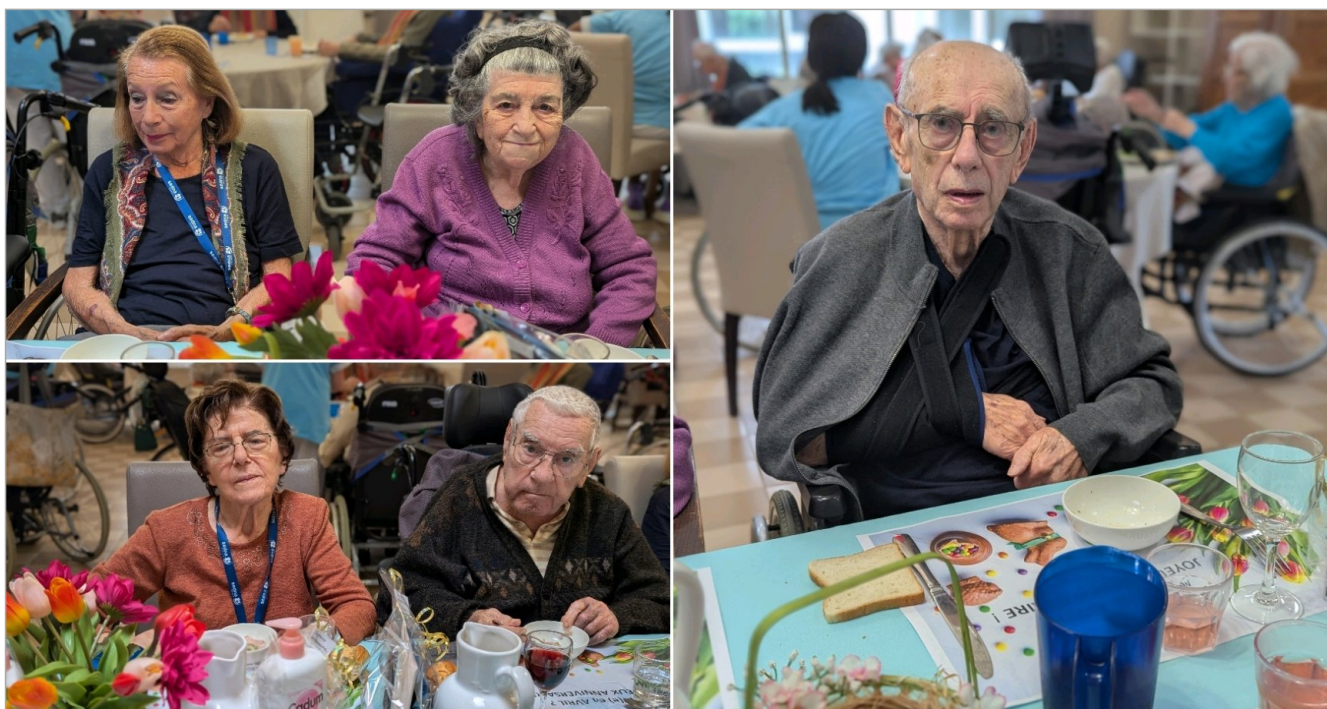
Mardi 28 avril : c'est la journée des anniversaires d'avril ! Une jolie table pour fêter ça !