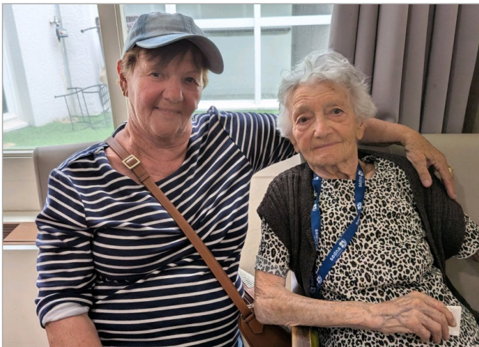
De jolis portraits de famille