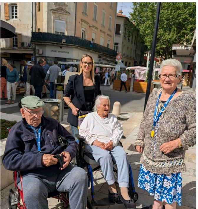
Jeudi 30 avril : Dernière sortie marché du mois