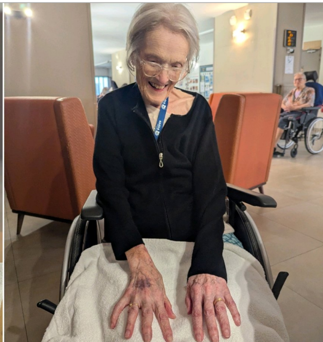
Mardi 21 avril : bar à ongles