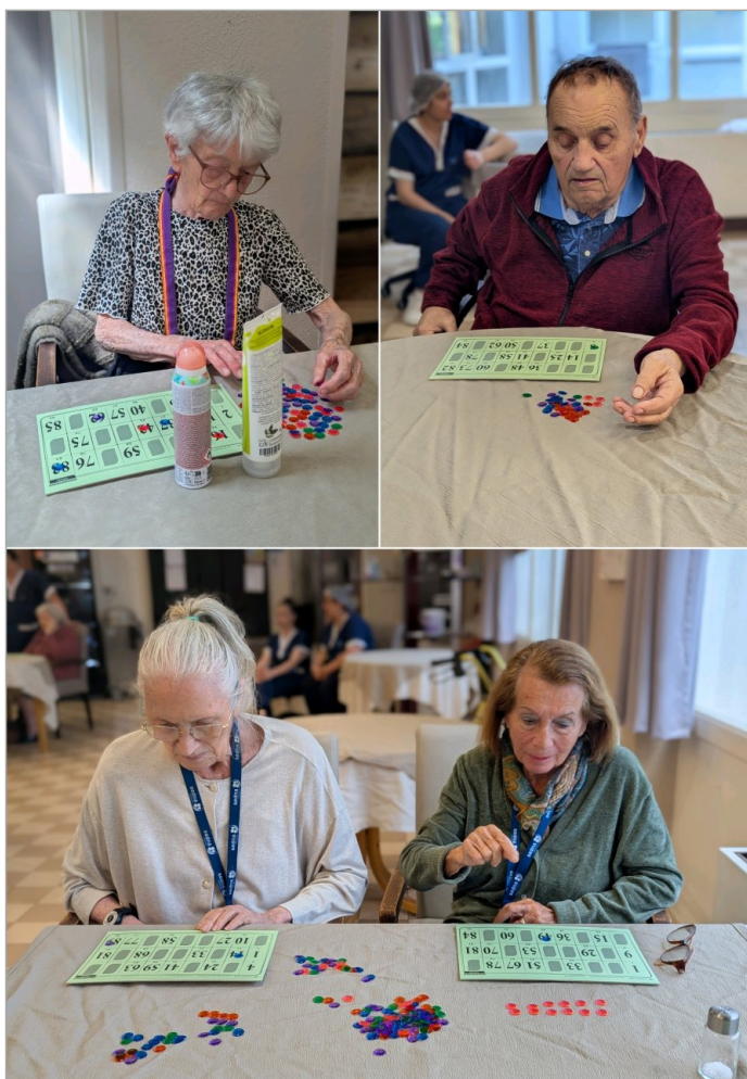
Loto du 21 avril : Concentration optimale ... Et voici notre première chanceuse !