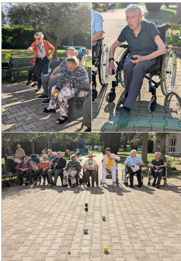
Alors tu tires ou tu pointes?