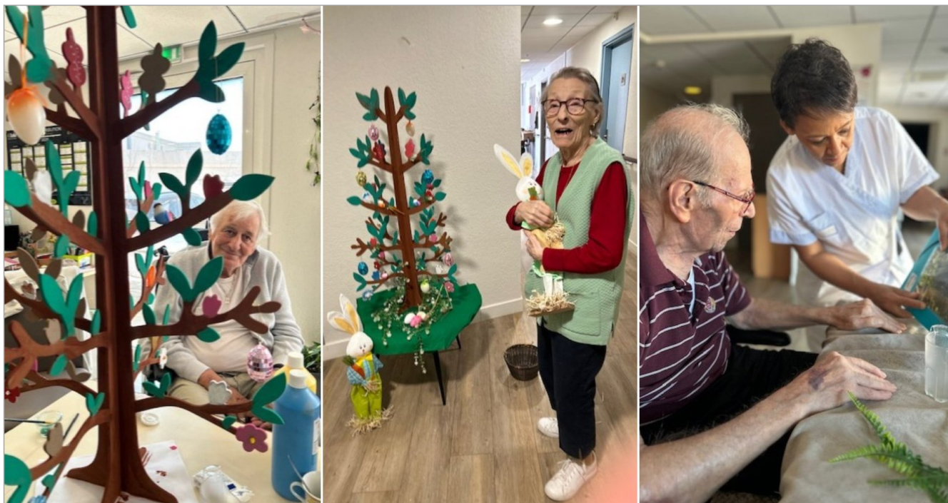
Les activités du WE de Pâques au PASA