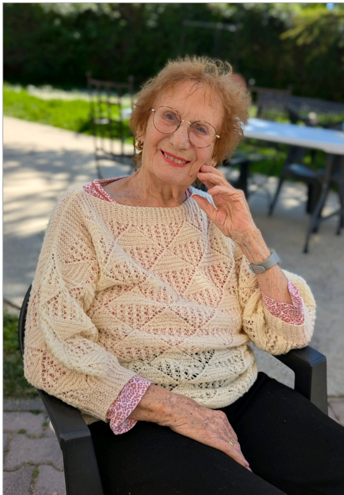
Un jour un portrait , celui de Mme G.