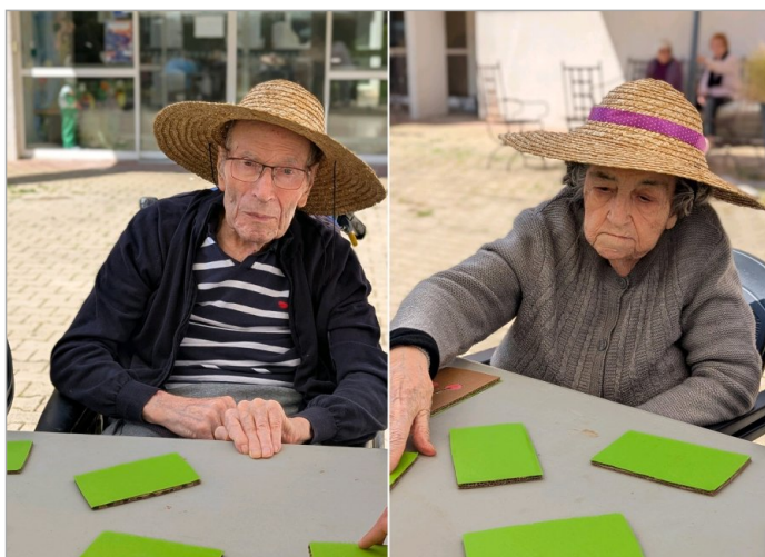
Les jeux du jeudi après midi se sont déroulés dehors