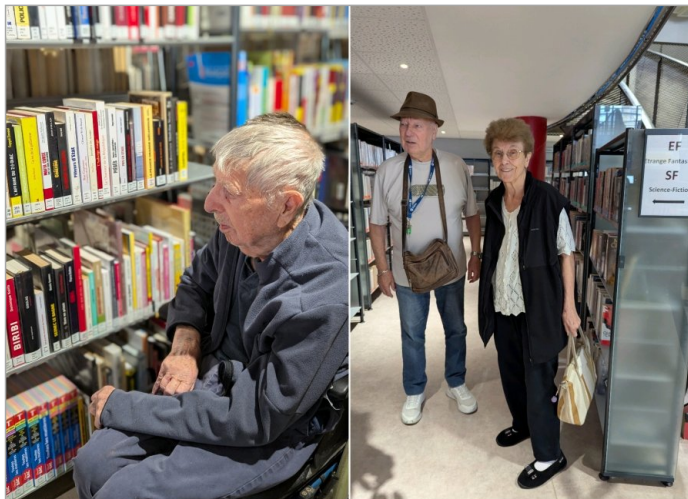
Au détour d'une allée .... Puis d'une autre... "C'est formidable!"