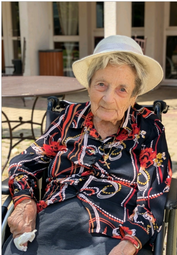
Un jour un portrait ... Celui de Mme G. Magnifique avec son chapeau !