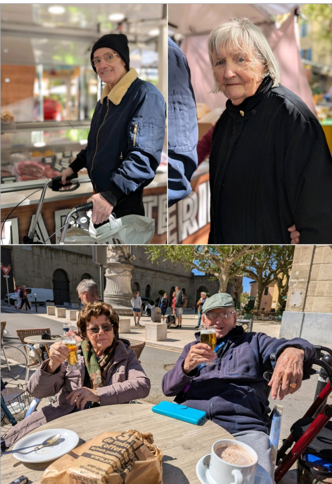
Jeudi 16 avril : encore une sortie marché qui se termine en terrasse ;-)