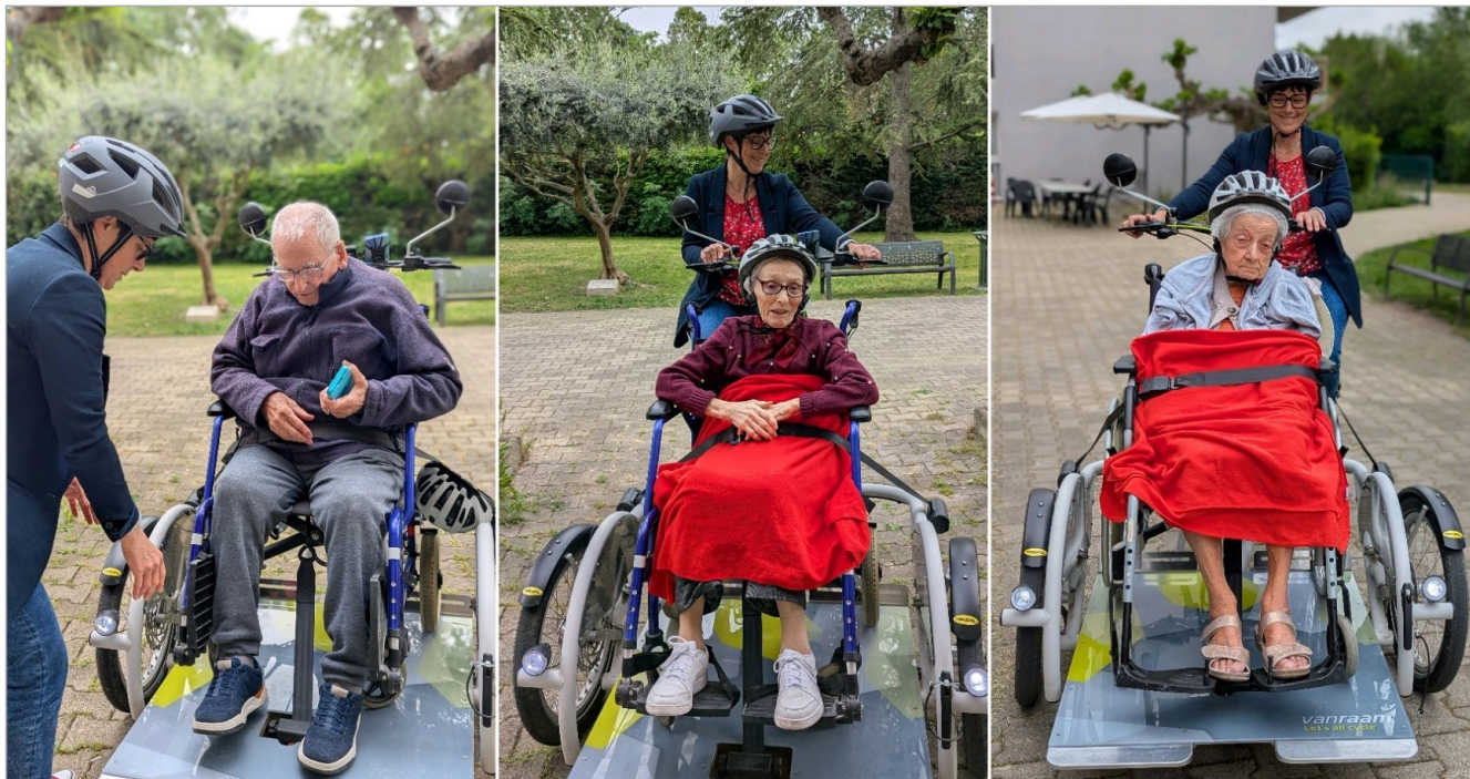
En route pour un tour de vélo avec "les balades du bonheur"